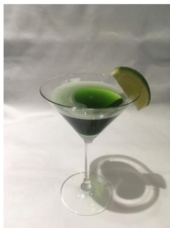
茶の香ギムレット