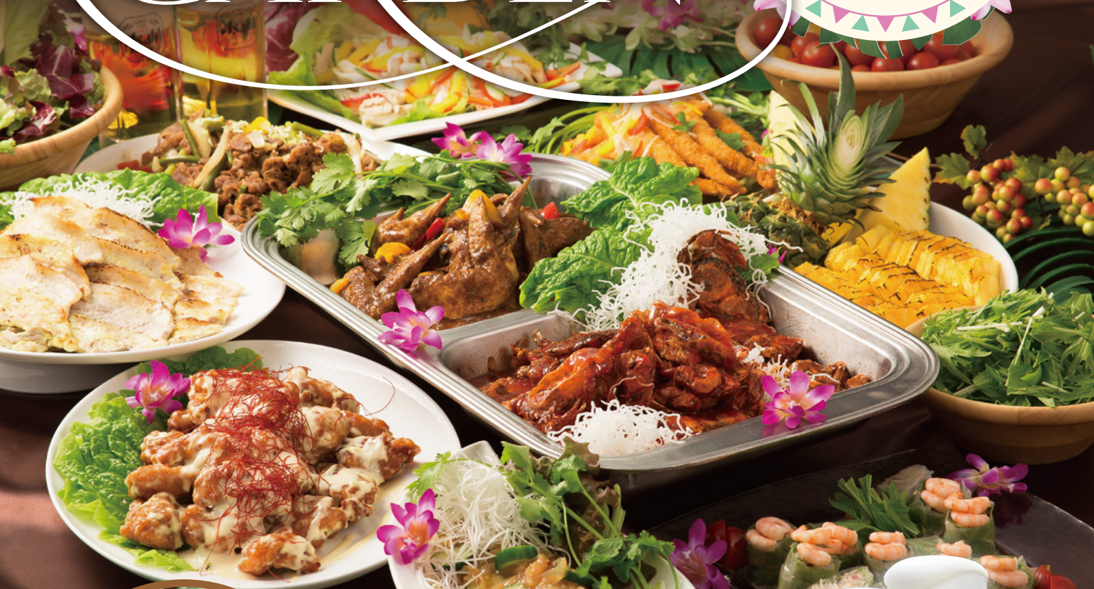
ソフトシェルのチリクラブ

今年、シンガポール料理を中心に30種類以上の料理が楽しめます！ 6月2日(金) ~ 8月31日(木) 日曜日~木曜日 17:30・21:00 [L.O 20:45] 金・土・祝前日 17:15・21:15 [L.O 21:00] 雨天中止