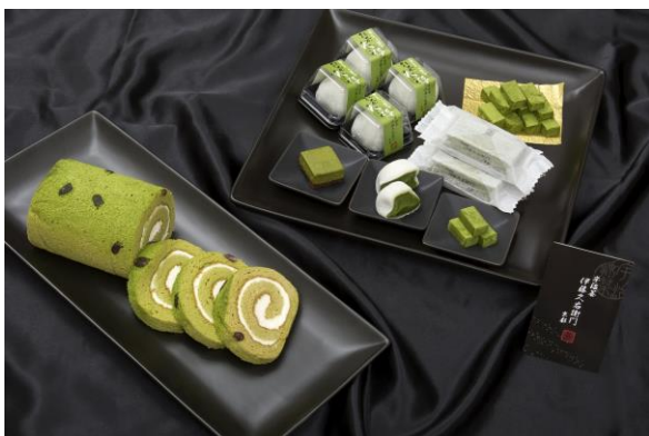
ウェルカムスイーツ (イメージ)

ロレーヌのバイキングで好評いただいている“スモークロー”をはじめ、ピラフやパスタ、サラダなど、ライトミールメニューも充実です。