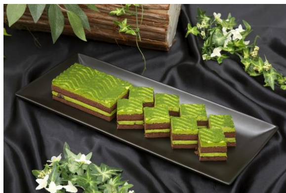
抹茶のミルクケーキ