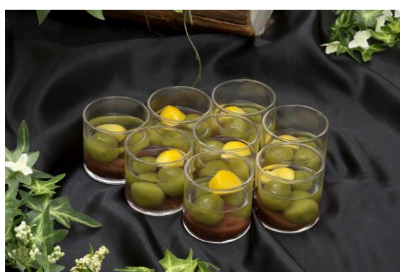
冷製抹茶白玉ぜんざい