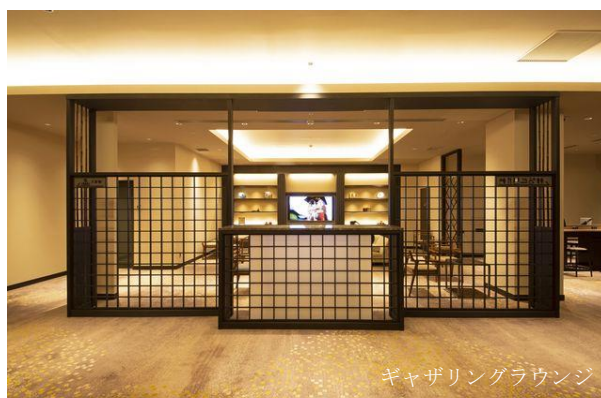
ギャザリングラウンジ