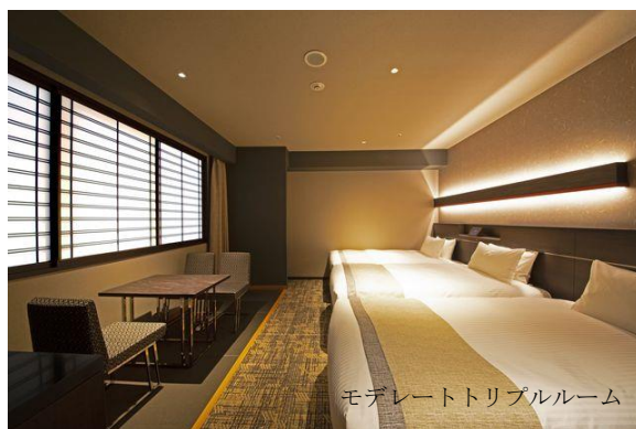
モデレートトリプルルーム