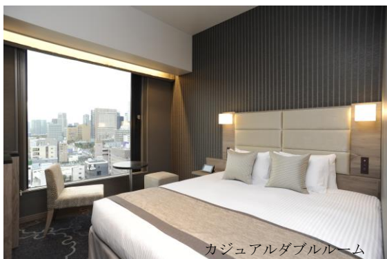
カジュアルダブルルーム

また、眺望の良い最上階 14 階と 13 階にはスーペリアフロアを設け、客室では女性を意識し、Panasonic のナノケアドライヤーやアメリカで歴史ある調剤薬局ブランドの C.O.Bigelow のコスメセットなどのアメニティをご用意しています。