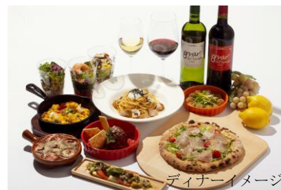
ディナーイメージ