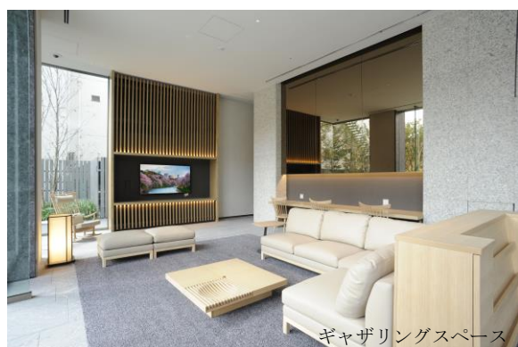
ギャザリングスペース

自動チェックイン/チェックアウト機を導入し、スピーディーに宿泊手続きをお済ませいただけます。館内には宿泊者専用のジムをご用意し、有酸素トレーニングマシンをご利用いただけます。また、1 階ギャザリングスペースにはライブラリーコーナーを設けております。インターネットのご利用や築地・銀座エリアに関する本の閲覧や設置してあるモニターの映像をご覧いただけるなど、観光情報を入手できる場となっています。