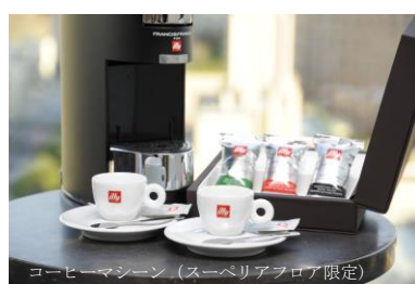
コーヒーマシーン (スーペリアフロア限定)