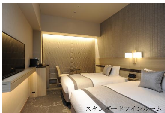
スタンダードツインルーム