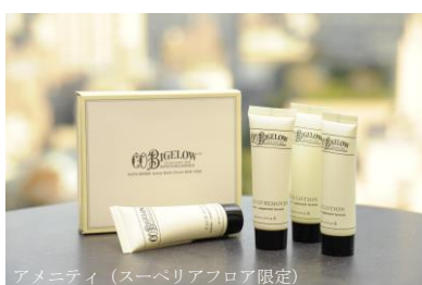
アメニティ (スーペリアフロア限定)