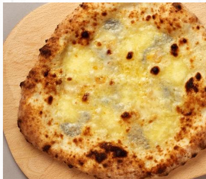
クアトロフォルマッジ Quattro Formaggi