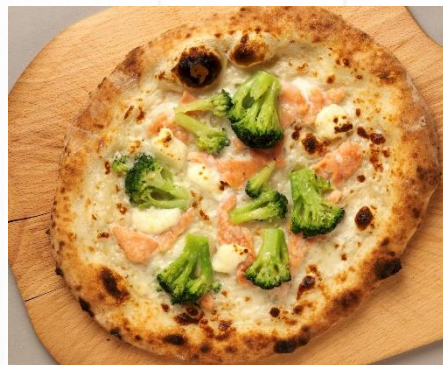
スモークサーモンと クリームチーズのピッツァ With smoked salmon Pizza with cream cheese