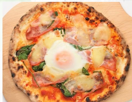
ほうれん草とベーコンの ビスマルク Spinach and bacon Bismarck