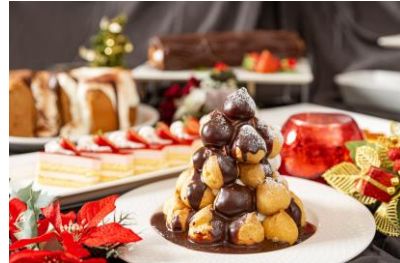
クリスマスディナービュッフェ料理(イメージ)