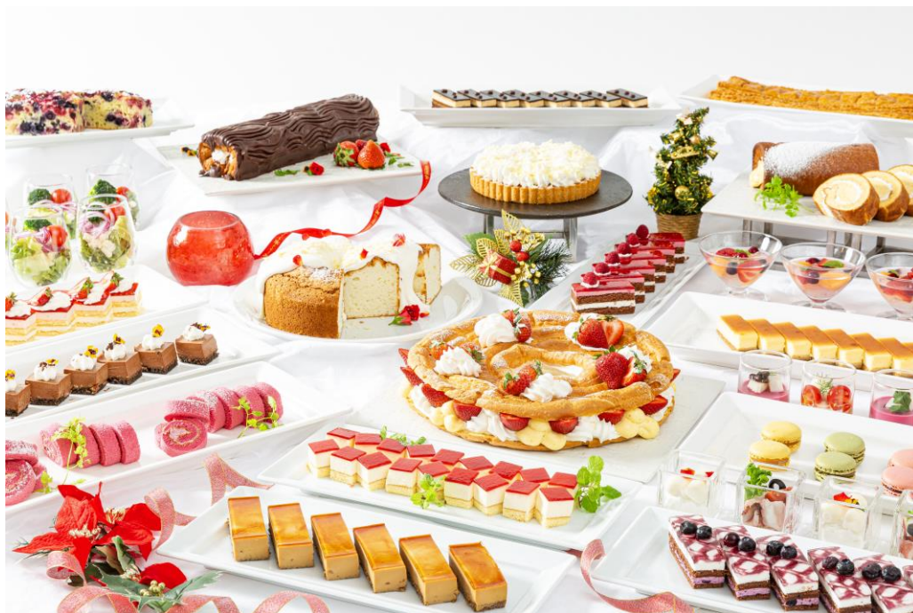
スイーツビュッフェメニュー(イメージ)

また、新春はご家族皆さままでお楽しみいただけるビュッフェをランチタイム、ディナータイムともに開催いたします。お正月もぜひロレーヌをご利用ください。