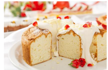
ホワイトチョコレートとベリーの パウンドケーキ