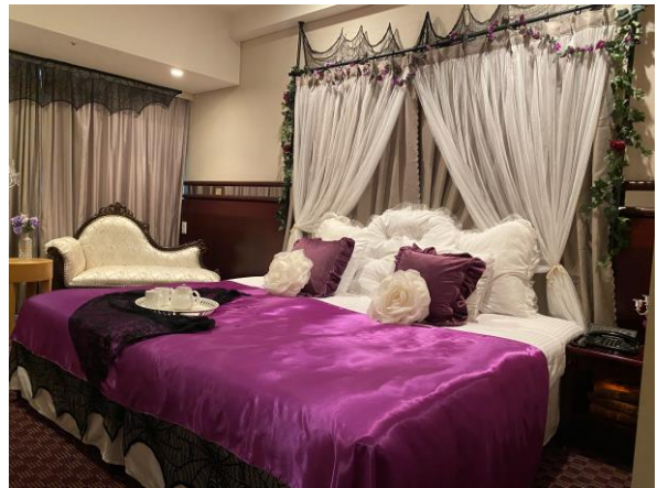
ハロウィーンスタンダードルーム