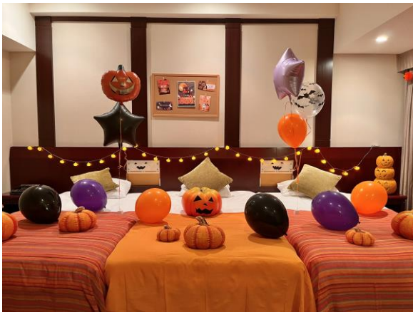
ハロウィーンスーパーリアルーム