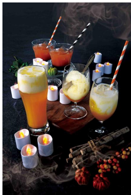
ハロウィーン特別ドリンク