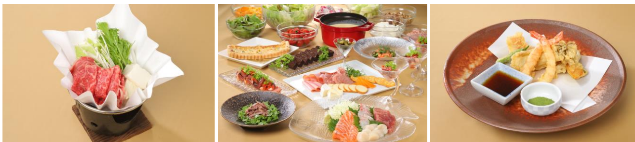
ランチメニュー(メイン:国産牛肉の紙鍋すき焼き風、ビュッフェメニュー、天ぷら盛り合わせ)