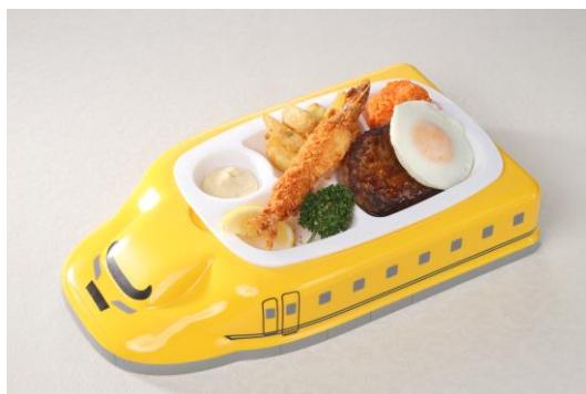
お菓子ガチャガチャコーナー、 新幹線プレート