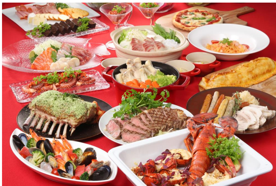
スペシャルビュッフェ(ディナーメニュー)

京都の初詣にもアクセスがよい当ホテルで、大切なご家族、ご友人と一年を締めくくり、健やかに新年をお迎えください。