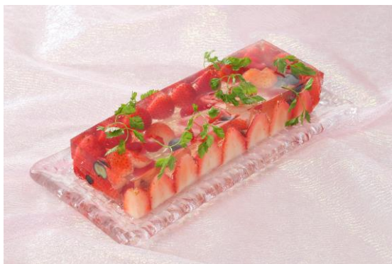
白ワイン風味のゼリー