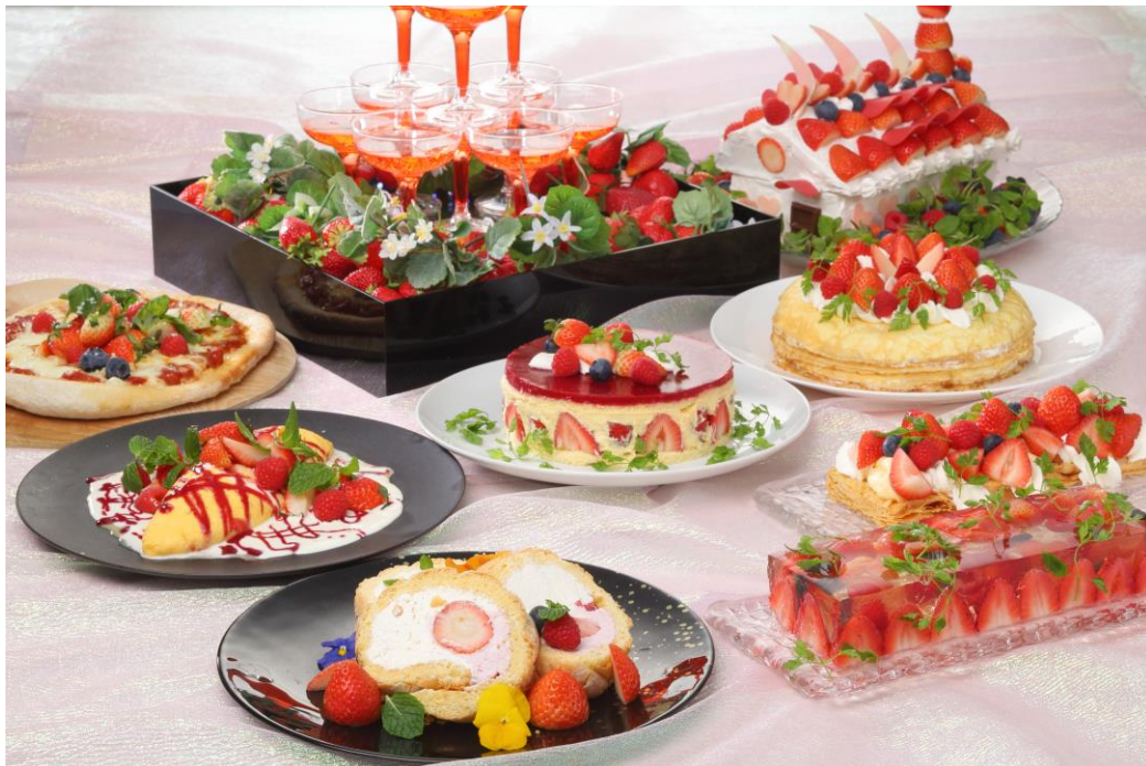
いちごbuffeメニュー(イメージ)

また、ドリンクを含めて全てのメニューにいちごを使った約60種類のメニューはbuffeスタイルでお好きなだけお召し上がりいただけます。いちごの屋根やえんとつが可愛い“おかしな家”、ゼリーの中にいちごがぎっしり詰まった“白ワイン風味のゼリー”、ビスキュイ生地を使ったいちごの“ロールケーキ”や濃厚な味わいの“フレジェ”などのスイーツから、ピッツァをいちごで楽しむ“恋するいちごのマルゲリータ”、ピンク色が可愛いいちごと明太子を合わせた“ストロベリー明太子クリームパスタ”や“berry ハンバーグ”、いちご風味の“赤いオムレツ”など意外性を追求した料理もぜひお楽しみいただき、いちごづくしの創作メニューをご堪能ください。