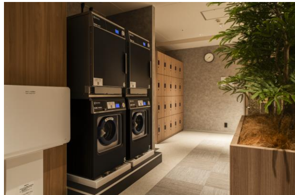
ランドリーコーナー（左:ユニバーサル・タワー、右:札幌）