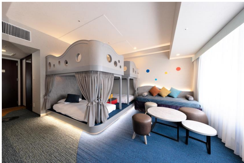
【バンクベッド】スーペリアルーム