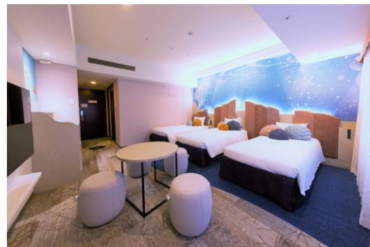
【リニューアル】スタンダードルーム(左)、スーペリアルーム(右)