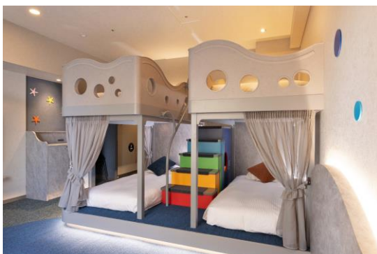
【バンクベッド】スーペリアルーム