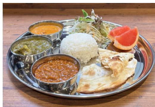
ランチメニューイメージ

【メニュー】 インドカレー5種類 (日替わり) 焼きたてナン食べ放題 サラダバー ドリンクバー