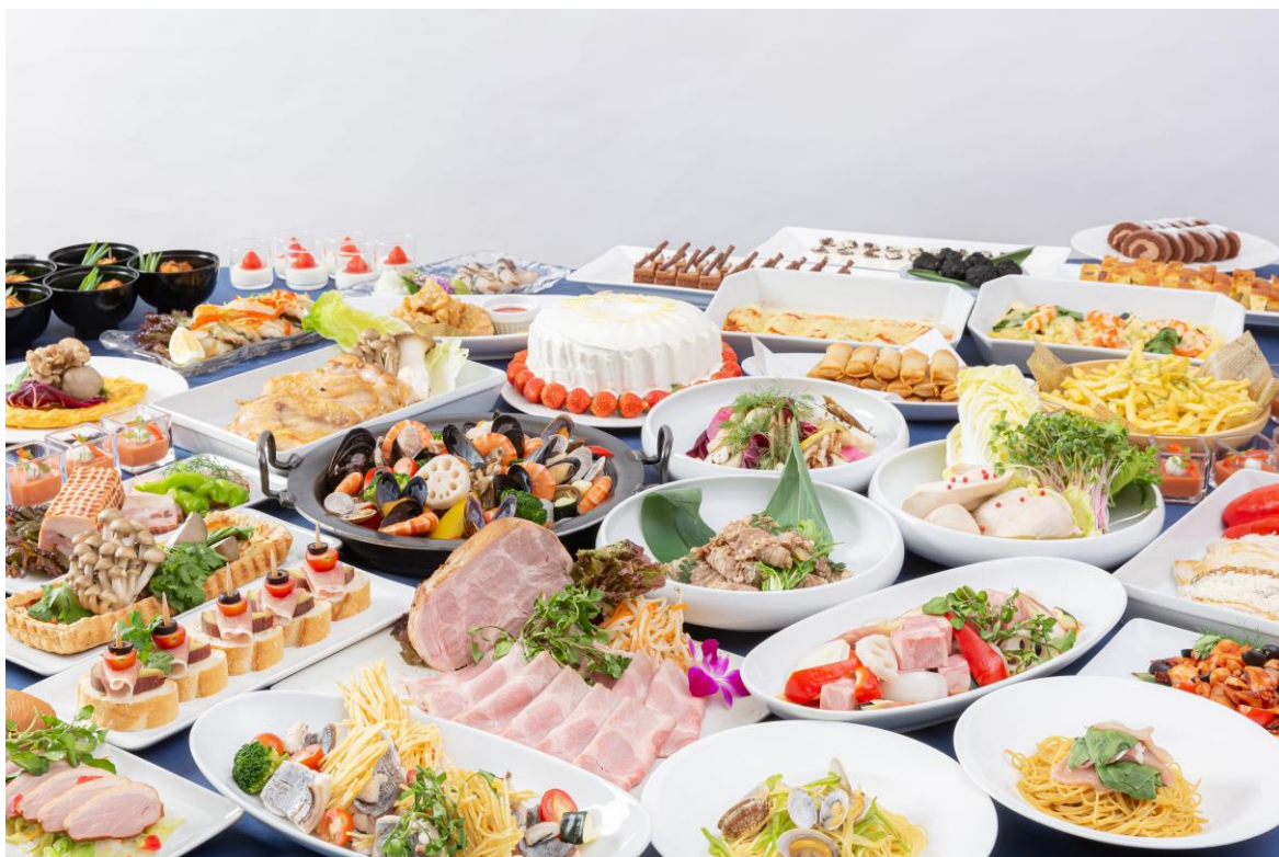
忘新年会プラン料理(イメージ)