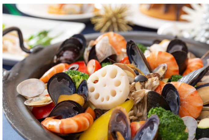
クリスマスディナービュッフェ料理(イメージ)