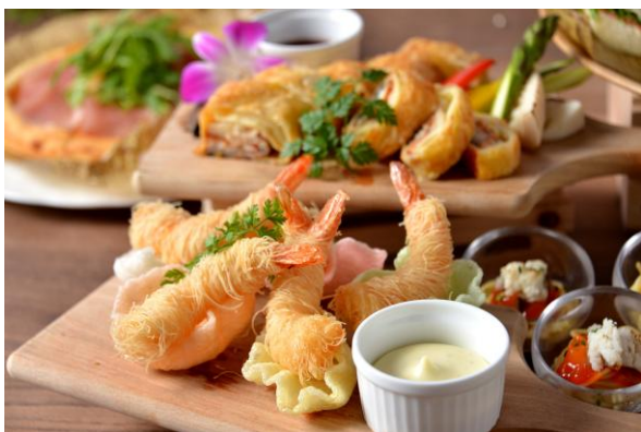
【Hot Section】海老のカダイフ揚げ トンナートソース

地上120メートルからのきらめく夜景とともに、小さなお子さまから大人まで楽しめるバラエティ豊かなメニューが、皆さまの食卓を賑やかに盛り上げます。ご家族やグループで、夏のディナータイムをお楽しみください。