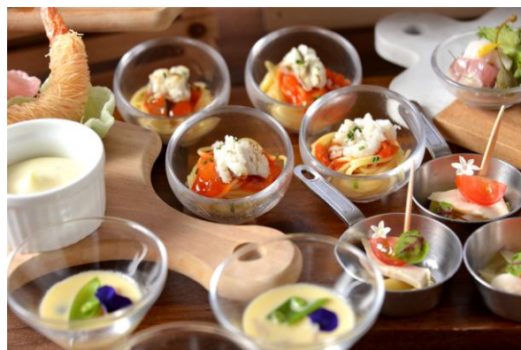
【Cold Section】炙り鱧とトマトのカッペリーニ