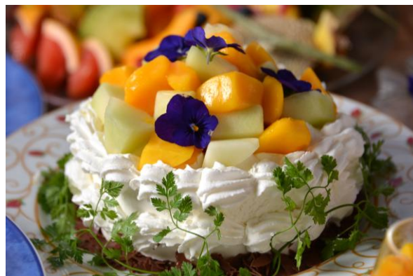
【Dessert & Fruits Section】 メロンとマンゴーのショートケーキ