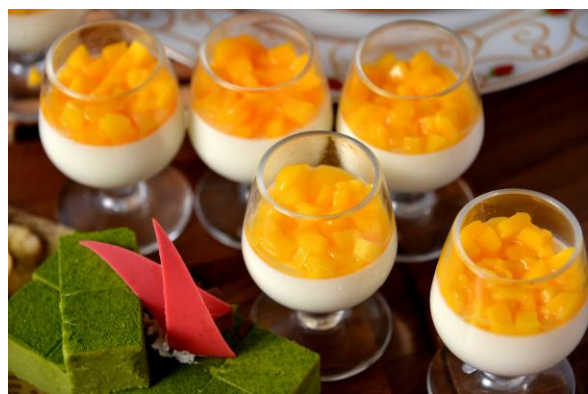
【Dessert & Fruits Section】マンゴーのパンナコッタ