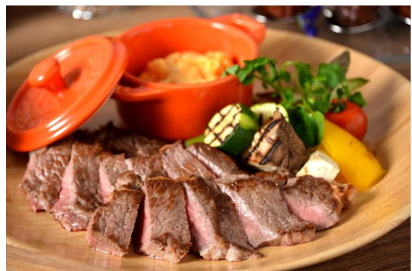
【Live Kitchen】ビーフステーキ マカロニチーズ添え 大阪ステーキソース

Live Kitchenでは、目の前で焼き上げる「ビーフステーキ マカロニチーズ添え 大阪ステーキソース」や、「炙りサーモン」や「炙り穴子」などの寿司、ポルチーニの香りが食欲をそそる「ズワイ蟹のリガトーニ ポルチーニ香るクリームソース」をその場で仕上げてご提供いたします。