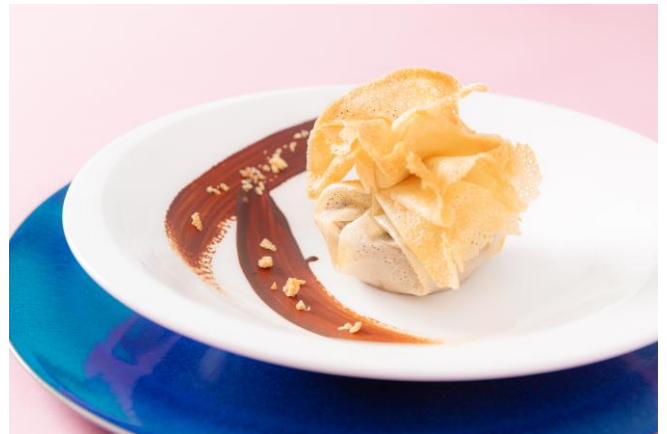
ウェルカムプレート「チョコレートタルトのパートブリック包み焼き」

ドリンクはフリードリンクにて、コーヒー、紅茶、ハーブティーなど、ソフトドリンク7種をご用意しております。