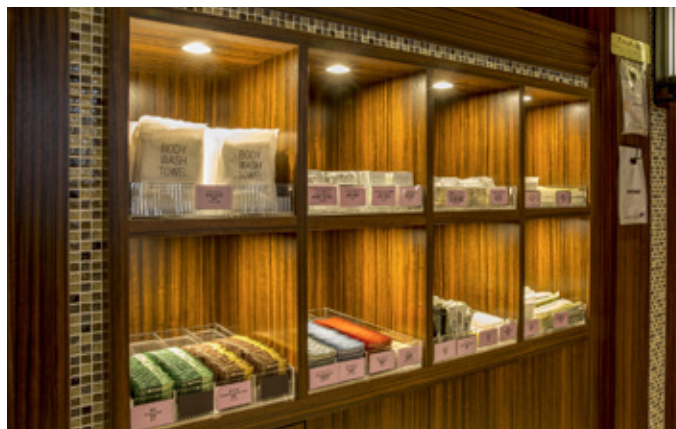
アメニティバー Amenity bar (※アメニティの内容は、時期によって異なります。 The lineup may be changed.)