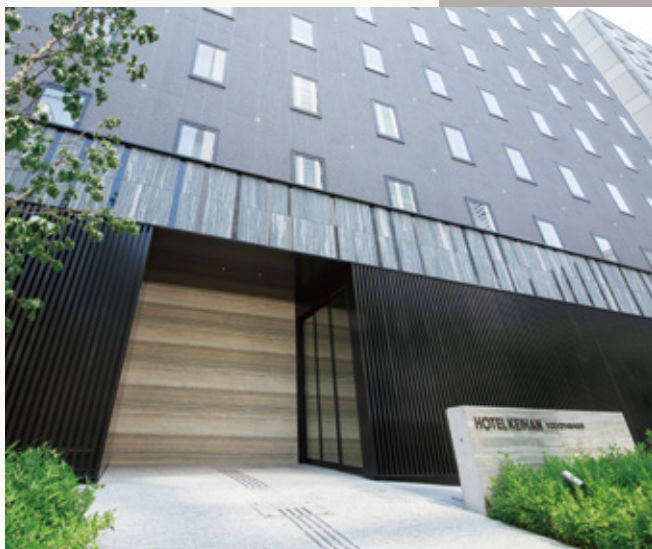
ホテル京阪 淀屋橋 外観 Hotel Keihan Yodoyabashi appearance