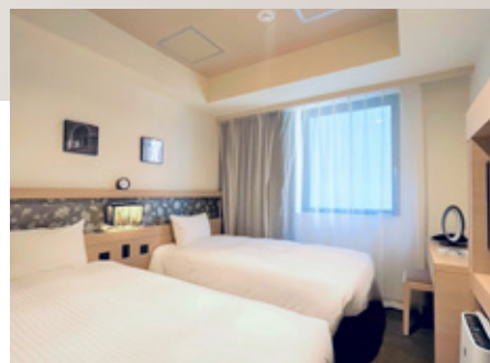
エコノミーツインルーム Economy twin room