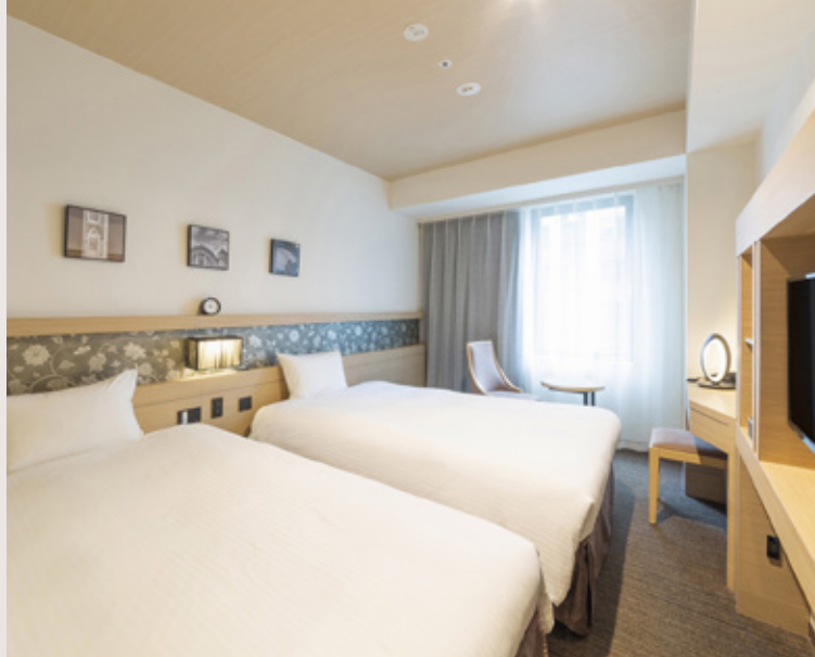
ツインルーム Twin room

Available for a wide range of purposes from business to sightseeing.