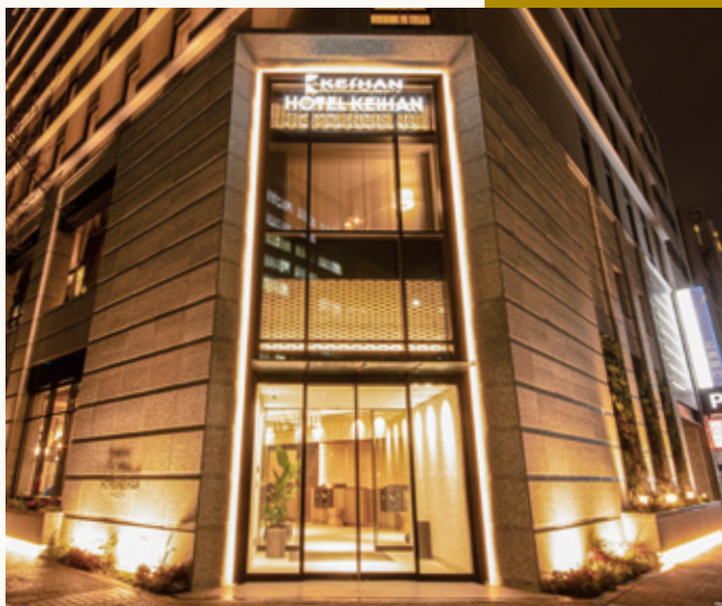
ホテル京阪 名古屋 外観 Hotel Keihan Nagoya Appearance

A perfect hotel both for business and pleasure, boasting a convenient location