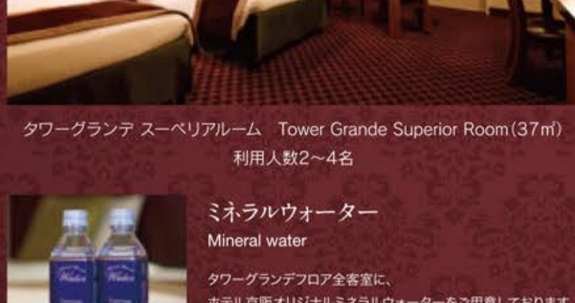
タワーグランデ スーパーリアルーム Tower Grande Superior Room (37㎡) 利用人数2~4名