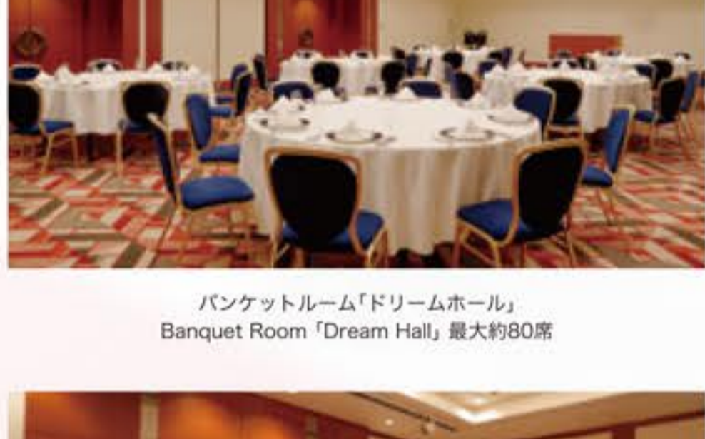
バンケットルーム「ドリームホール」 Banquet Room「Dream Hall」最大約80席