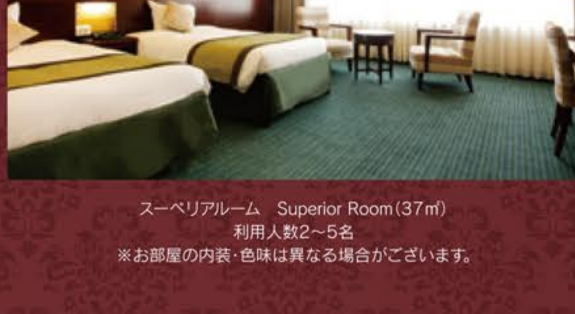
スーパーリアルーム Superior Room (37㎡) 利用人数2~5名 ※お部屋の内装・色味は異なる場合がございます。

Our well appointed rooms are stylish and modern. All rooms are equipped with large windows offering pleasant atmosphere and it gives you special time.