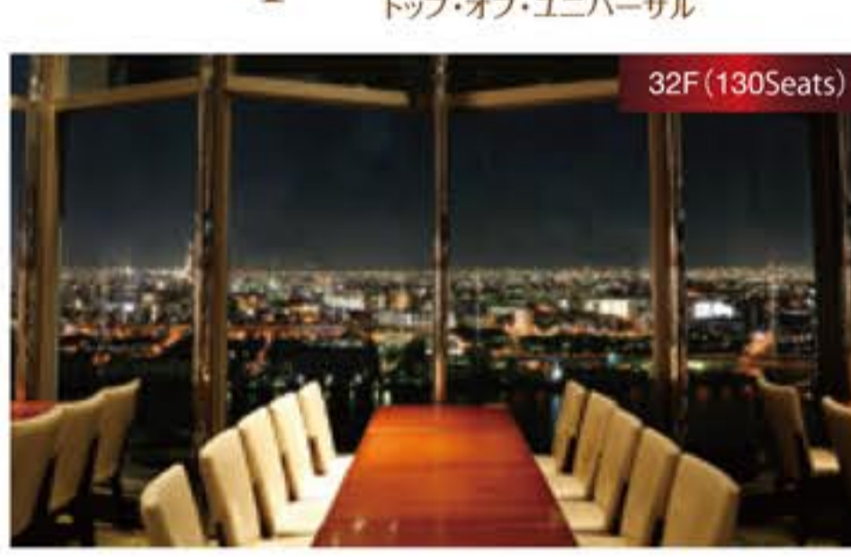
スカイレストラン&バー「トップ・オブ・ユニバーサル」 Sky Restaurant & Bar「Top of Universal」