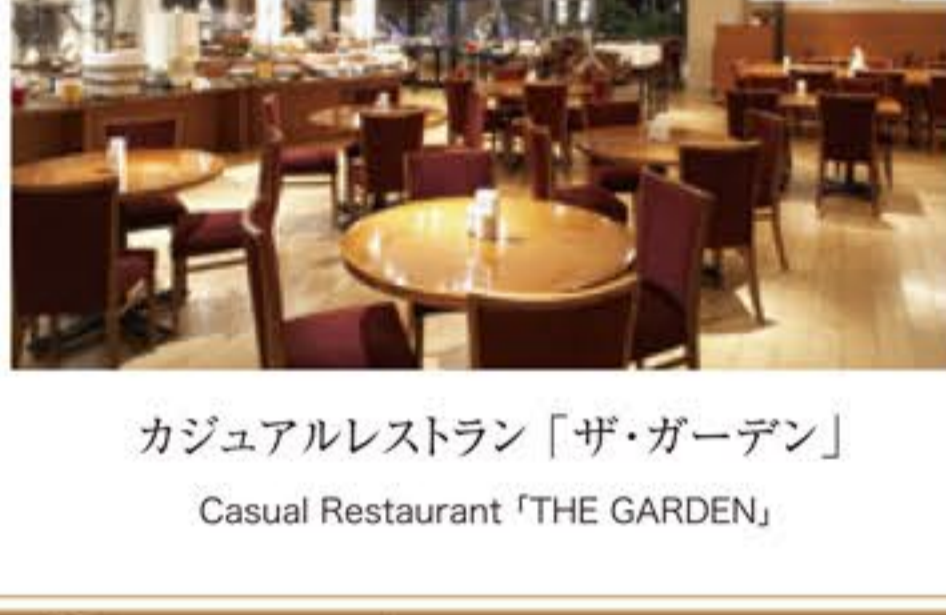
カジュアルレストラン「ザ・ガーデン」 Casual Restaurant「THE GARDEN」