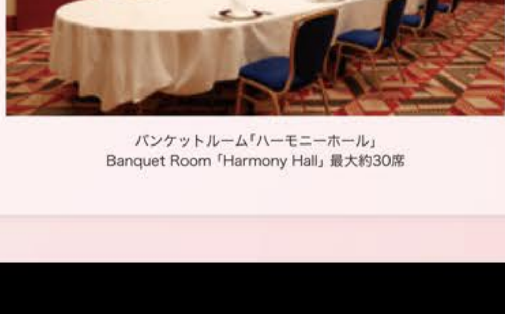
バンケットルーム「ハーモニーホール」 Banquet Room「Harmony Hall」最大約30席