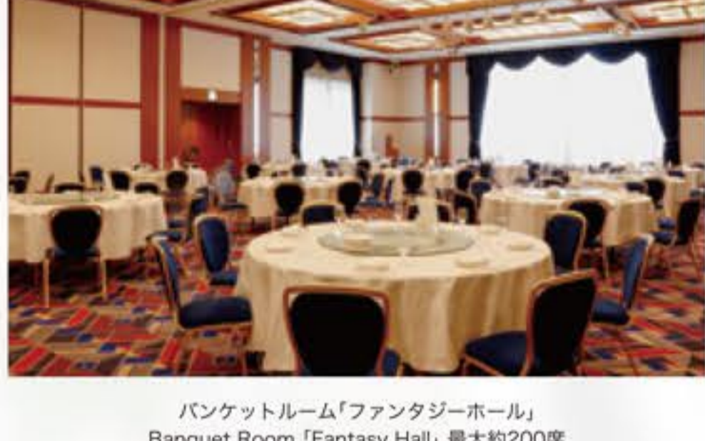
バンケットルーム「ファンタジーホール」 Banquet Room「Fantasy Hall」最大約200席

We have 3 banquet rooms that can be best suit your needs and the number of attendees.