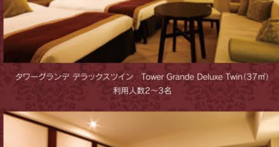
タワーグランデ デラックスツイン Tower Grande Deluxe Twin (37㎡) 利用人数2~3名

We suggest “The Relaxation for adults” with casual design and chic colors. Please spend a high-grade luxurious time in good-quality space here.