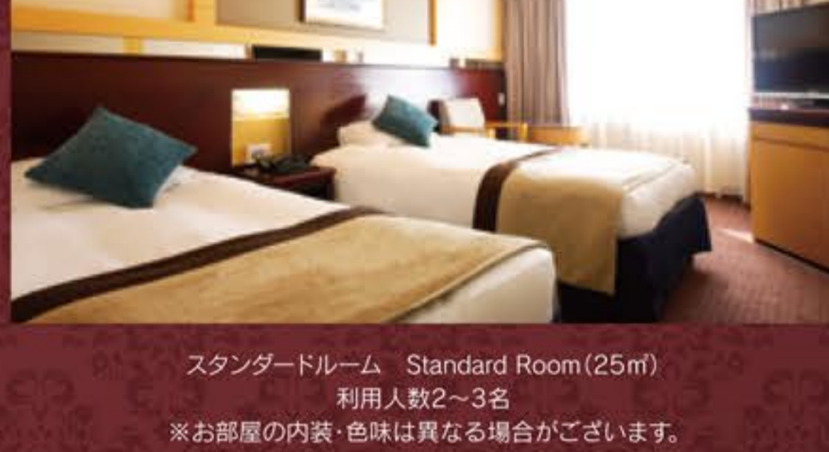
スタンダードルーム Standard Room (25㎡) 利用人数2~3名 ※お部屋の内装・色味は異なる場合がございます。