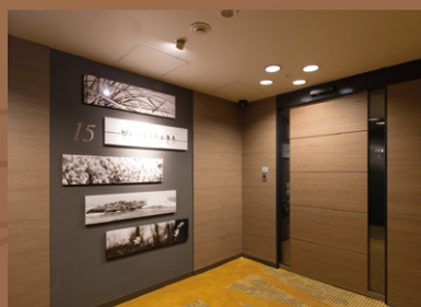
スーペリアフロア Superior floor

We provide the upgraded relief and relaxation.