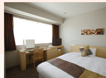
シングルルーム Single room