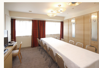
ファンクションルーム Function room