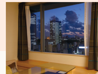
夜景も楽しめる眺望 Night view from the room