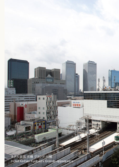
ホテル京阪 京橋 グランデ 外観 Hotel Keihan Kyobashi Grande appearance