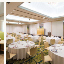
宴会場 Banquet hall