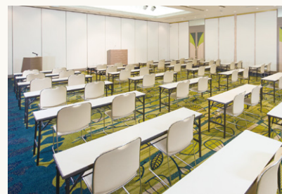
かがやきの間(東) Kagayaki (east)