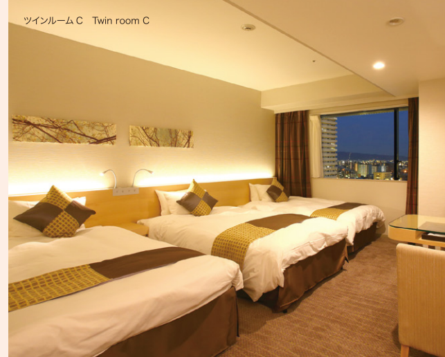
ツインルーム C Twin room C

Enjoy sleeping with the bed made in Simmon's Co. Our guest rooms could suit your comfortable stay for business and leisure.