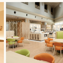
レストラン Lorraine Restaurant Lorraine