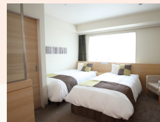
ツインルームB Twin room B