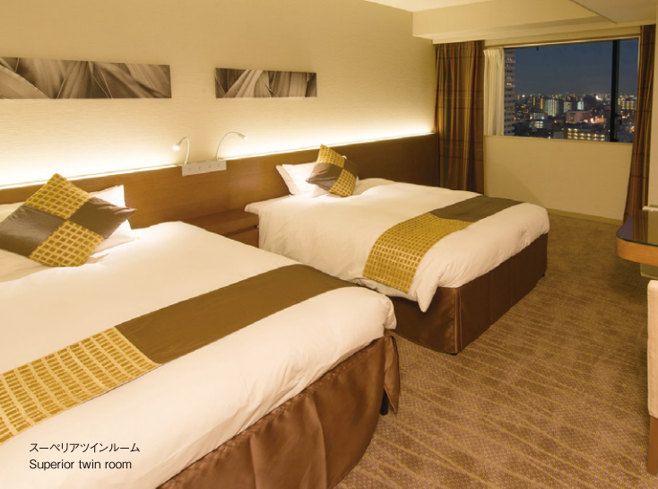
スーペリアツインルーム Superior twin room