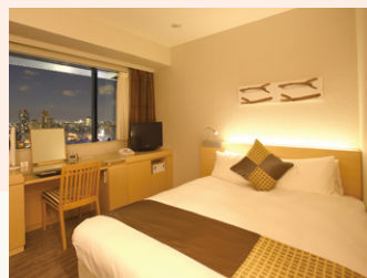
ダブルルーム Double room