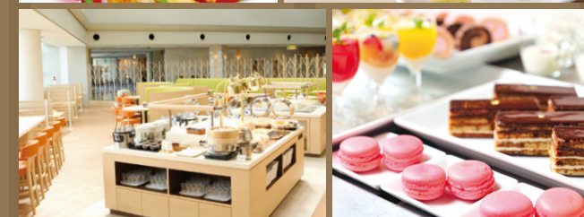
ホテル 7F のバイキングレストラン Buffet restaurant 7F.