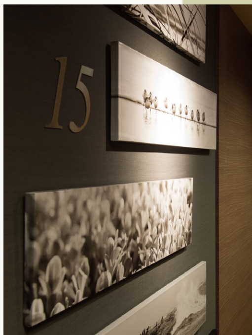
最上階 スーベリアフロア The thirteenth-floor superior floor