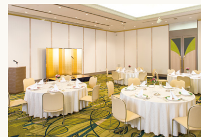
かがやきの間(西) Kagayaki (west)