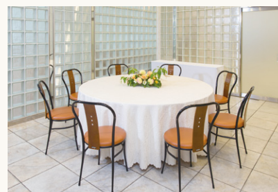
クリスタルルーム Crystal room