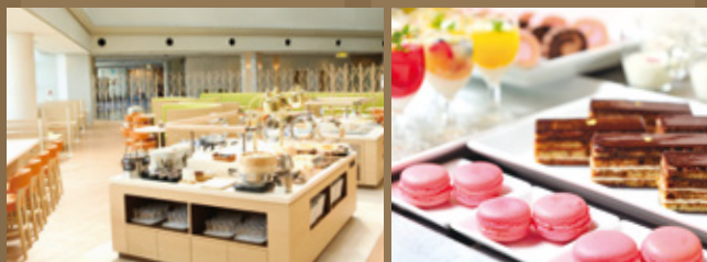
ホテル 7F のバイキングレストラン Buffet restaurant 7F.