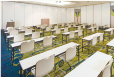
かがやきの間(東) Kagayaki (east)