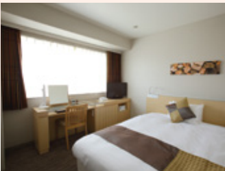
シングルルーム Single room

Enjoy sleeping with the bed made in Simmon's Co. Our guest rooms could suit your comfortable stay for business and leisure.