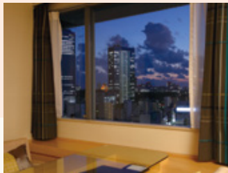
夜景も楽しめる眺望 Night view from the room