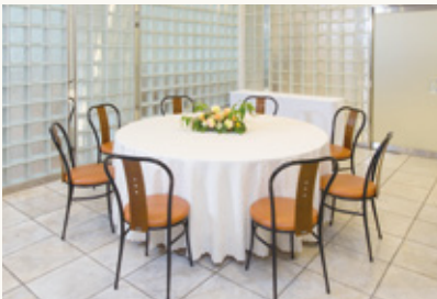
クリスタルルーム Crystal room