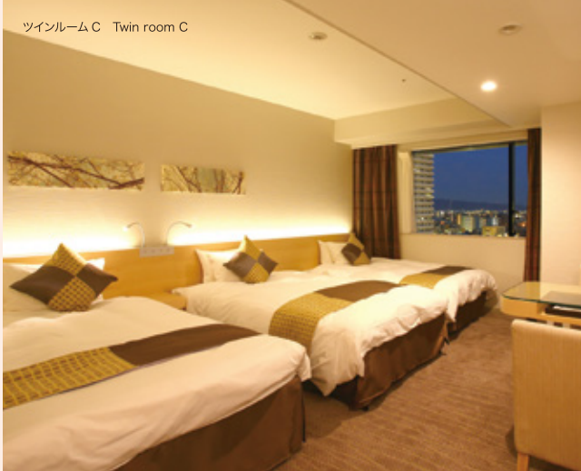
ツインルームC Twin room C