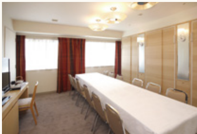
ファンクションルーム Function room