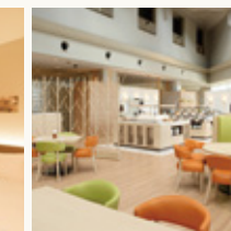
レストラン Lorraine Restaurant Lorraine