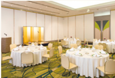
かがやきの間(西) Kagayaki (west)