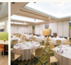
宴会場 Banquet hall