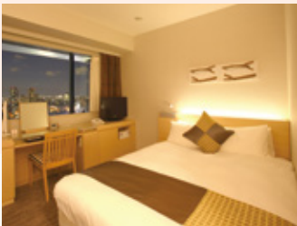
ダブルルーム Double room