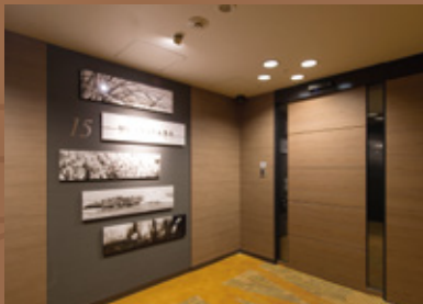
スーペリアフロア Superior floor

We provide the upgraded relief and relaxation.