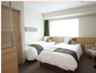
ツインルームB Twin room B