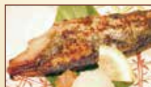
さわらの西京焼き